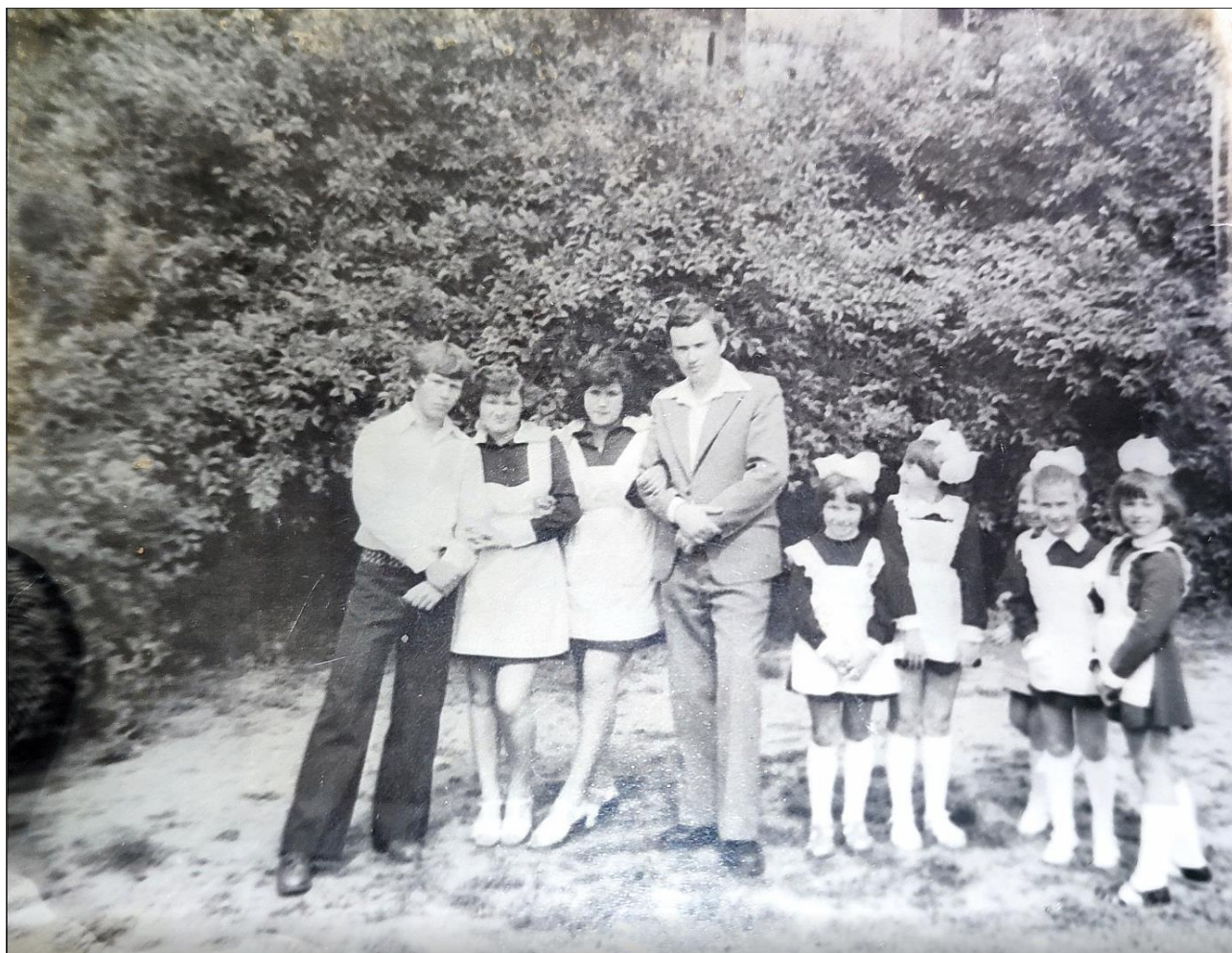
Останній дзвінок, 1979 р.(з особистого альбому респондента).